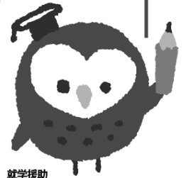
就学援助 イメージキャラクター ツクロウくん

学校教育法などにもとづいて、小中学校の子どもがいる家庭に学用品費や学校給食費などを市町村が援助する制度です。子どもたちの安心で楽しい学校生活のために、気軽に就学援助制度を活用してみませんか。